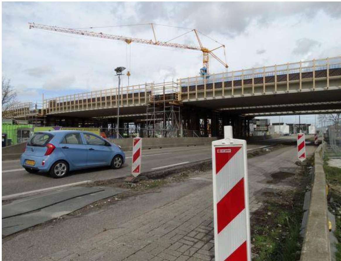
Máximabrug in aanbouw