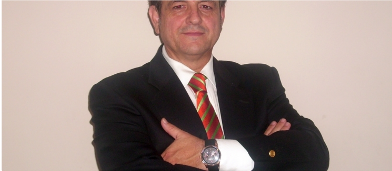
"La internacionalización de mi empresa ha sido fundamental para superar la crisis" ( http://thebusinesstraveller.es/la-internacionalizacion-de-mi-empresa-ha-sido-fundamental-para-superar-la-cri-sis/ )